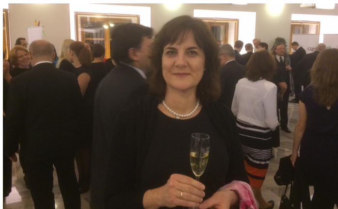
Państwa przedstawicielka rozkoszuje się lampką szampana