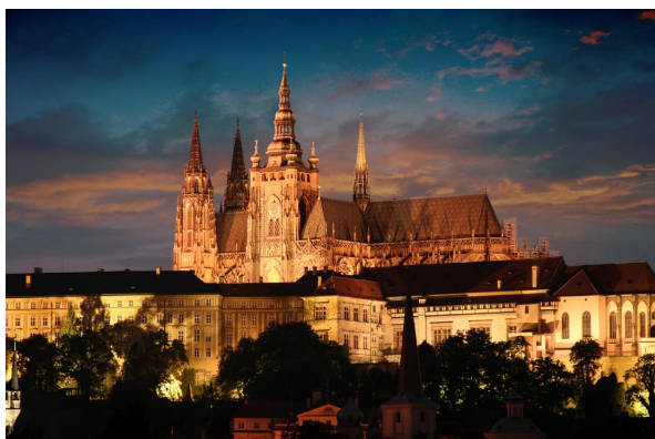
Zamek i twierdza w Pradze

Może i my powinniśmy „pójść czeską drogą”? Budować silne, inspirujące sieci, których najlepszych przedstawicieli będziemy głośno i otwarcie chwalić; przydzielić politykom rolę facylitatora i zaangażować szanowanych artystów, którzy oprawią przemówienia i uroczystości w piękną, inteligentną ramę. To działa motywująco i wyznacza odpowiednie obszary koncentracji! Podsumowując, jesteśmy pod wrażeniem tego, czego dokonały i dokonują Czechy – to europejski model do naśladowania.