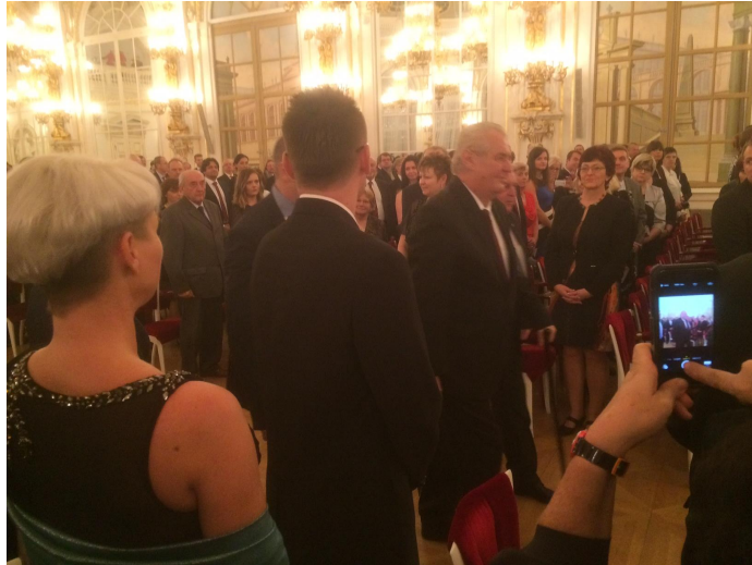
Na gali pojawia się prezydent Miloš Zeman